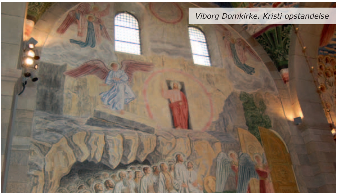
Viborg Domkirke. Kristi opstandelse