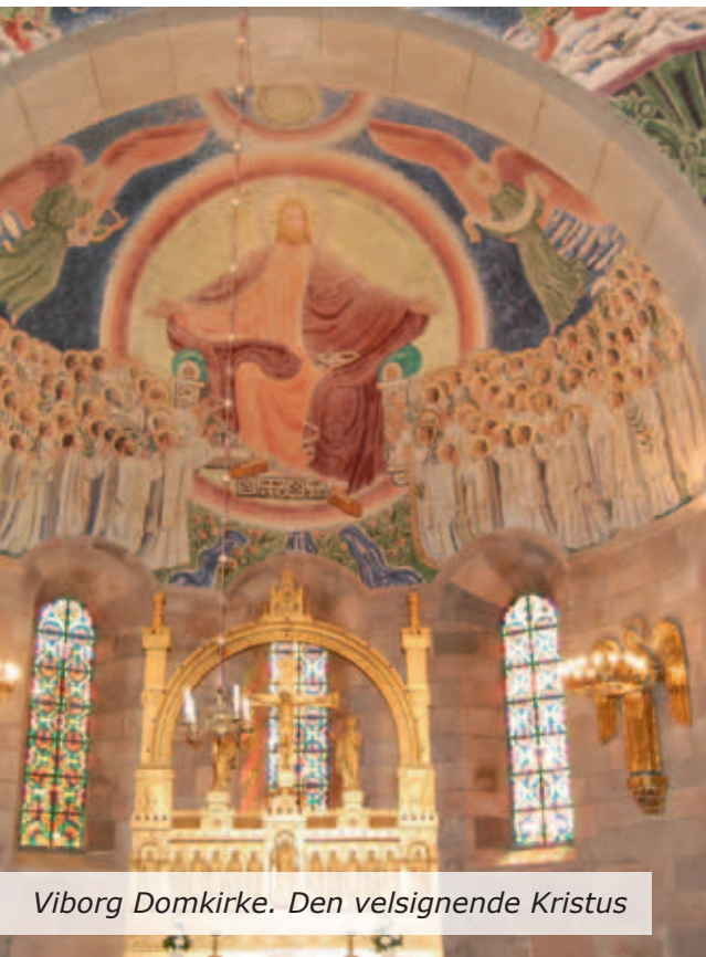
Viborg Domkirke. Den velsignende Kristus

I Viborg så vi omridset af den kirke, som Hans Thausen prædikede i og vi var inde i Viborg domkirke og se Joachim Skovgaards fantastiske bibelfortælling, der er malet direkte på væggen med freskomalerier. Her så vi bl.a. den frihed, som maleren Joachim Skovgaard havde taget sig i forhold til bibelens fortællinger, da han malede. For Joachim Skovgaard har ikke kun malet hvad han kunne læse i bibelen. Han har også selv digtet videre. F. eks. er der malet et billede af Adam i paradiset have. Adam sidder alene – han har givet alle dyrene navne og nu sidder han så der – og nu keder han sig. Det med at Adam kedede sig, det står der ingenting om i bibelen – det har maleren selv fundet på!