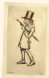
Søren A. Kierkegaard