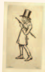
Søren A. Kierkegaard