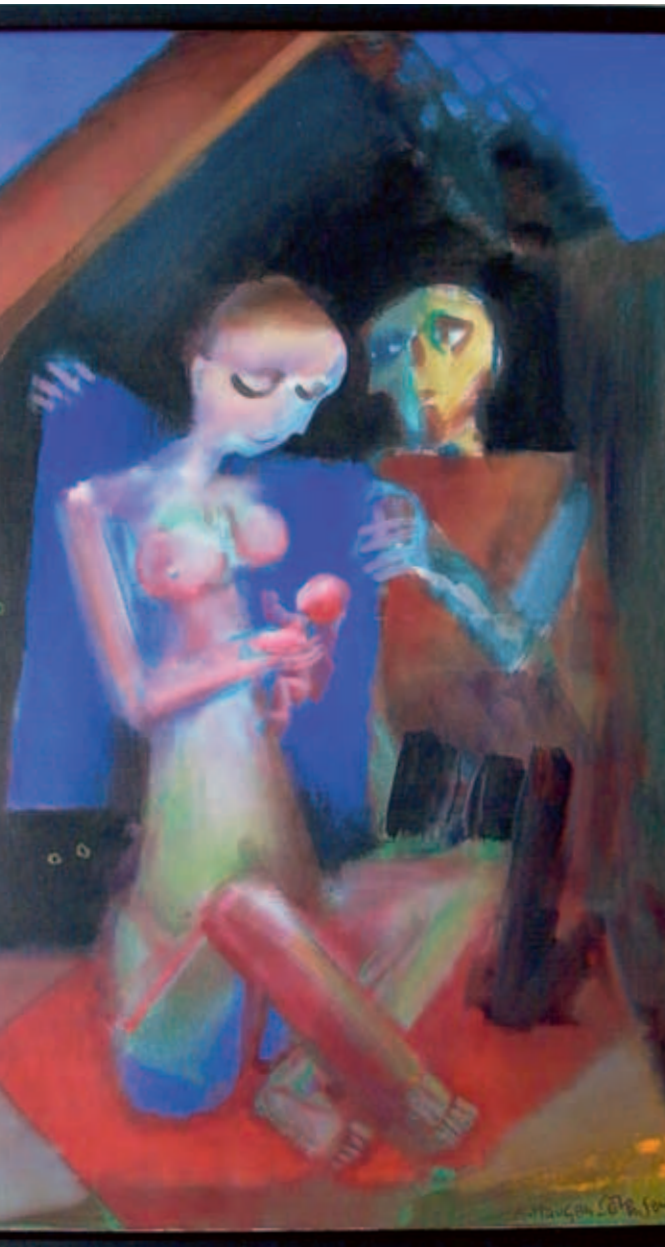
Jesu fødsel af Arne H. Sørensen.

Træffes som regel onsdag på tlf. 97 49 13 24 og e-mail: khje@km.dk.