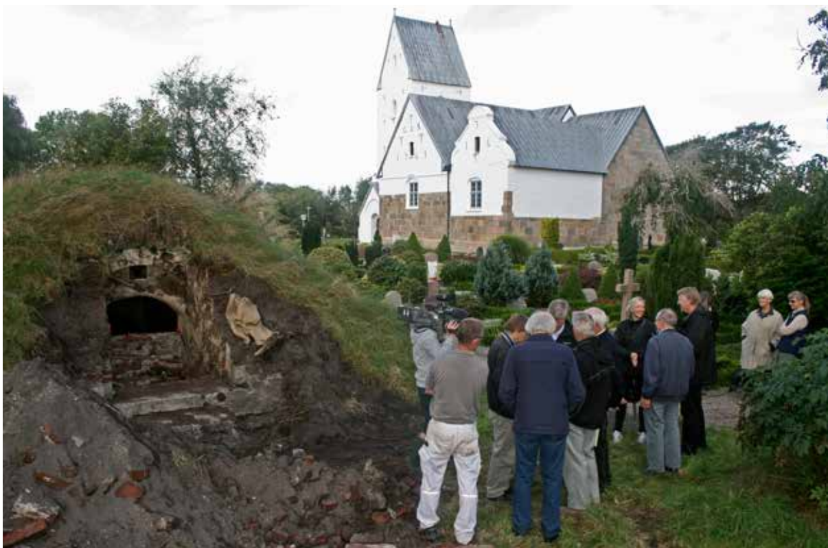
Den 18. september 2012 åbnedes efter 55 års stilhed adgangen til Tang-familiens gravkapel i højen på Ulfborg kirkegård. Årsagen var Realdania Bygs ønske om som administrator af Det Tang-Vosborgske Legat at få dette afviklet ved at anvende restkapitalen til at restaurere gravhøjen og dens indre. En alsidig skare af arkitekt, håndværkere, kirkeværge, byrådsmedlemmer, præst, graver, museumsfolk og andre interesserede tog del i begivenheden.