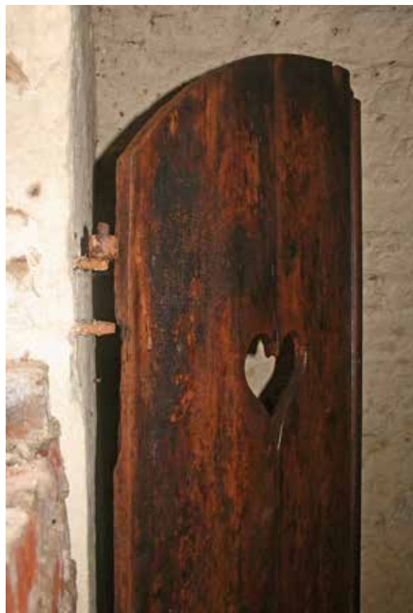
Den frønnede dør med hjertehullet var indtil foråret 1967 adgangen til gravhvælvingen. Ældre mennesker husker endnu synet af en hvid gipsengel gennem bullet inde i kappellet.