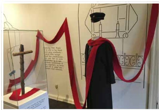
Kaj Munks præstegård.

sen af gudsforladthed hører nemlig med til et menneskeliv.